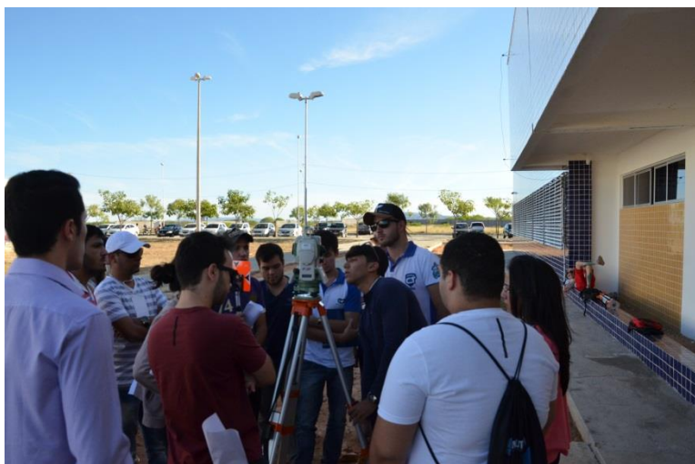
Minicursos ministrados pelos alunos.

O evento possibilitou ainda que alunos da instituição, dos cursos de Engenharia Civil e do Bacharelado em Ciência e Tecnologia, conduzissem minicursos de Ftool – Módulo Básico, Topocad2000 e Operação de Estação Total.