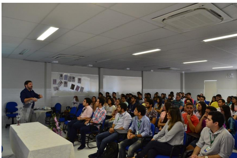
Palestra de abertura do I SEC.