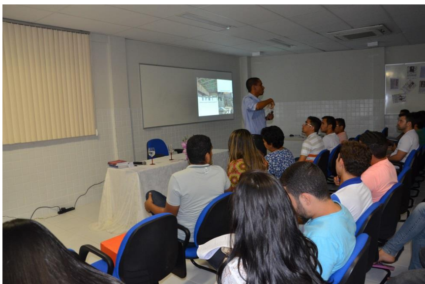
Palestra de encerramento.